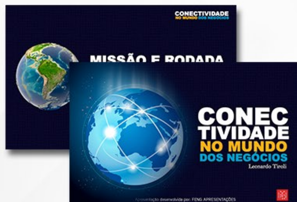
APRESENTAÇÃO PALESTRA RNB - ROTARIANOS E NEGÓCIOS BRASIL