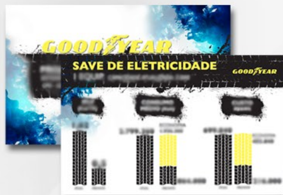
APRESENTAÇÃO DE PROJETO CF ENGENHARIA PARA GOODYEAR