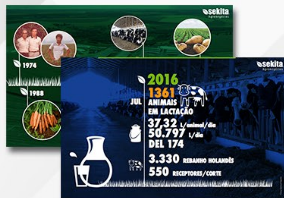
APRESENTAÇÃO DIA DE CAMPO SEKITA AGRONEGÓCIOS