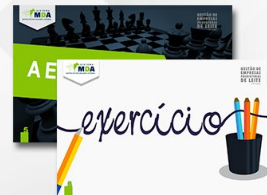
APRESENTAÇÃO PARA CURSO CLÍNICA DO LEITE - ESALQ USP/SP