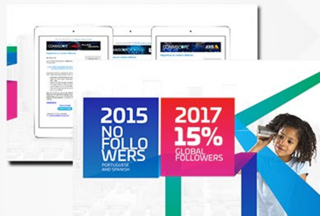
APRESENTAÇÃO CONGRESSO COMMSCOPE AÇÕES DE MARKETING AMÉRICA LATINA